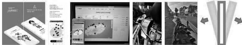
[그림1. EV PASS 앱(APP), 관제시스템 lot전동킥보드]

- (주)이브이패스는 단순 이동형 전동킥보드와는 달리, 전동킥보드로 제주를 보다 특별하게 즐길 수 있도록 한 관광형 전동킥보드 웨어링 서비스를 제공하고 있음. GPS장치 IoT탑재 전동킥보드 EVKICK(무인 공유전동킥보드)을 개발, 현재 제주 및 순천지역에서 서비스 운영 중. 또한 총 31개의 EV로드(가장 안전하게 라이딩 할 수 있는 아름다운 제주 길)를 개발하고, 이를 중심으로 전동킥보드 여행을 할 수 있도록 설계한 국내 최초 전동킥보드 전용 관광플랫폼 EVTOUR 서비스 이행을 앞두고 있음.